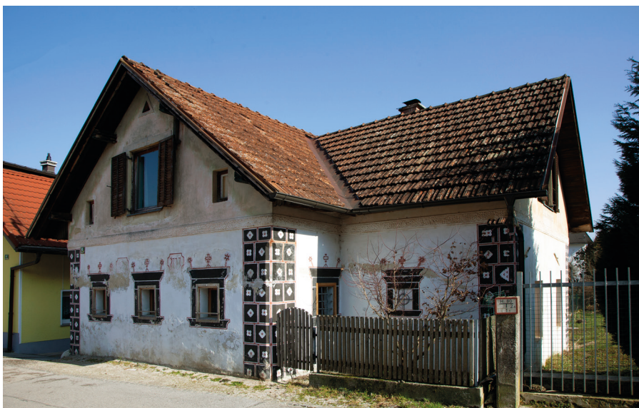
Stara Rajšpova hiša v Gunccljah, na pročelju je Letnica 1777, kar pade v oči. Freske, oboki v notranjosti ...

Rojen je v bil v Gunccljah 13. septembra 1944. In v Gunccljah je živel vse svoje življenje.