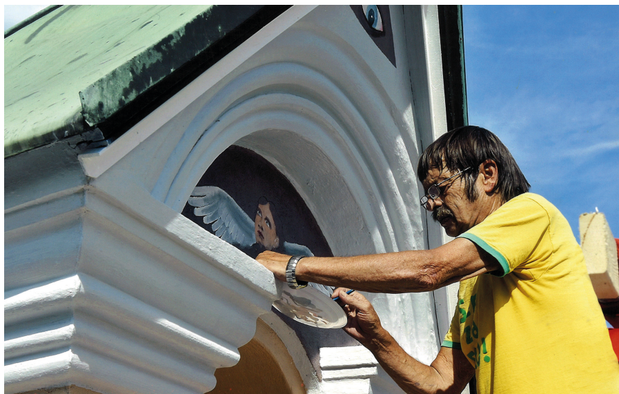
Obnova kapelicev v Guncljah.