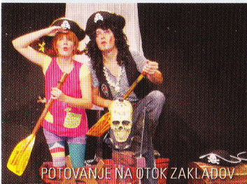
POTOVANJE NA OTOK ZAKLADOV

Pogumni gusarski kapitan Val je našel strgan starodavni zemljevid, ki vodi do otoka zakladov. V pristanišču vkrca posadko in skupaj odpotujejo na otok Taka Tuka. Misleč da jih na otoku čaka Zamorski kralj, da mu vzamejo manjkajoči del zemljevida. Na veliko presenečenje vseh pa ga pričaka najbolj zabavna, najmočnejša in vseh ukan polna Pika Nogavička. Ne samo, da Pika prelišči kapitana, celo njegovo ladjo si sposodi in z otroki odpluje na otok ČUNGA-LUNGA. A tudi gusar Val, vajen morja in ukan, ima svoj skrivni načrt. Konca ne smemo izdati, lahko samo povemo, da je srečen.