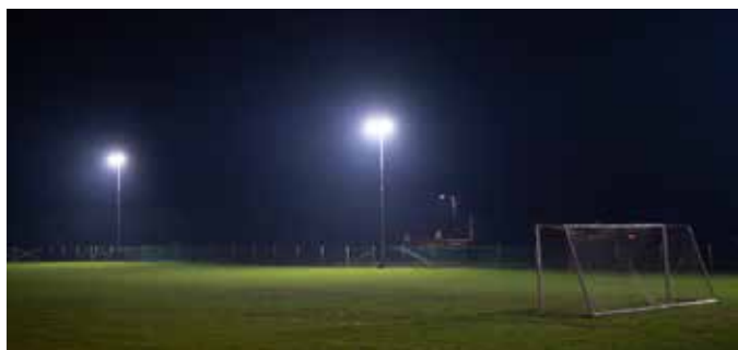
Igrišče z naravno travo; arhiv: NK Arne Tabor

Epidemija koronavirusa je v letošnjem letu močno posegla na vsa področja našega življenja. Vplivala je na izvedbo naših športnih aktivnosti in nam onemogočila izvedbo tradicionalne zaključne prireditve ob koncu sezone. Ne glede na vse pa se v klubu ves čas trudimo, da v skladu z veljavnimi ukrepi in možnostmi, ki jih imamo, vsem selekcijam nogometašev omogočamo čim boljše pogoje za njihov športni in osebnostni razvoj. Pri tem so nam bili tudi letos v veliko pomoč vsi nogometaši in njihovi starši, sponzorji, donatorji, prostovoljci in številni drugi, ki so nam s finančnimi in materialnimi sredstvi, donacijami in prostovoljnimi delom omogočili izvedbo nogometnih treningov in tekem, dodatnih brezplačnih tekaških treningov za otroke (projekt NLB Šport mladim) in izboljšanje infrastrukturnih pogojev za delo z mladimi.