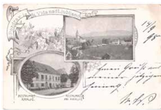
Stara razglednica