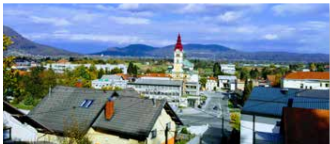
Naš kraj, posnet z »Grčka«, danes močno poraščene jase na robu Šentviškega hriba.

Tako je bilo, ko so hodili peš, se vozili z vlakom, tramvajem in trolejbusom, sedaj se vozimo z avtobusi mestnega prometa, najpogosteje v avtu osebnega prestiža!