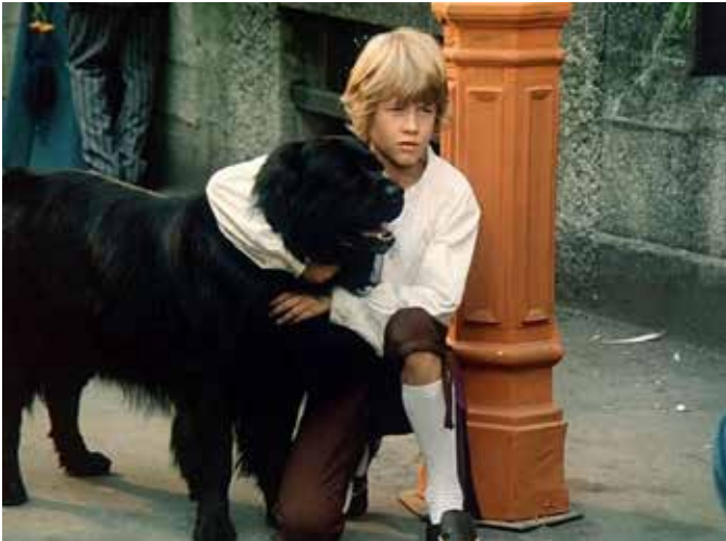
Sreča na vrvtici

saj ni bilo daleč. Dirjali so po bližnjih travnikih. Na koncu je bila sreča brez vrvice.