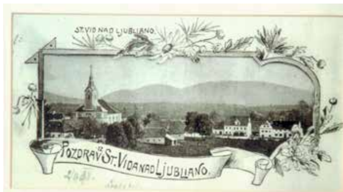
Stara razglednica

Nisem populist, živim sam s seboj, v mislih z menoj je rojstni kraj, Št. Vid nad Ljubljano – danes Šentvid.