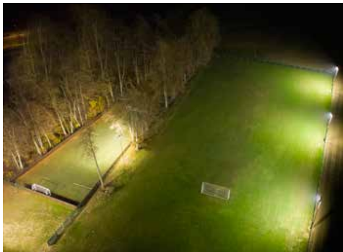
Igrišči z naravno in umetno travo

Poleg športnih aktivnosti, izpeljanih v skladu z vsemi omejitvami, smo v letošnjem letu veliko naredili tudi za izboljšanje infrastrukturnih pogojev. V spomladanskih mesecih smo prenovili spodnje garderobne prostore s kopalnicami in uredili okolico kluba, v jeseni pa smo končali z ureditvijo (postavitve ograje) in osvetlitvijo pomožnega nogometnega igrišča, kar nam omogoča izvedbo treningov tudi v večernih urah.