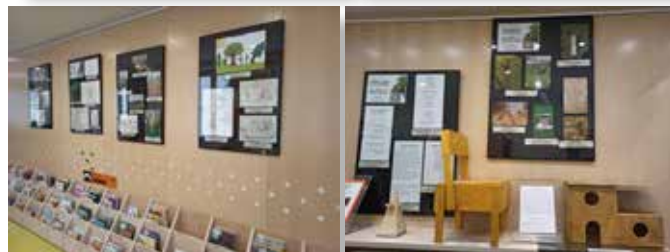
Razstava v knjižnici Šentvid

Ob tem naznanjamo temo Šentviških dnevov 2021, ki je 30-letnica samostojne Slovenije. Vse inštitucije, društva, organizacije v ČS Šentvid vabimo, da se nam v mesecu juniju pridružijo pri praznovanju s svojim dogodkom, prispevkom. Za možnost sodelovanja in nadaljnje informacije nam pišite na društvoipc@gmail.com .