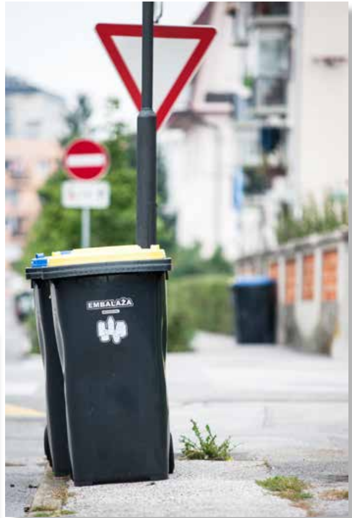
Zabojniki na pločnikih, cestiščih in drugih javnih površinah so nevarni za pešce, kolesarje in voznike; arhiv: VoKa-Snaga

Odvoz kosovnih odpadkov je enkrat na leto brezplačen, uporabniki pa ga naročite, ko ga potrebujete. To storite tako, da izpolnite e-naročilnico na www.mojiodpadki.si in počakate na klic, da se dogovorite za datum odvoza.