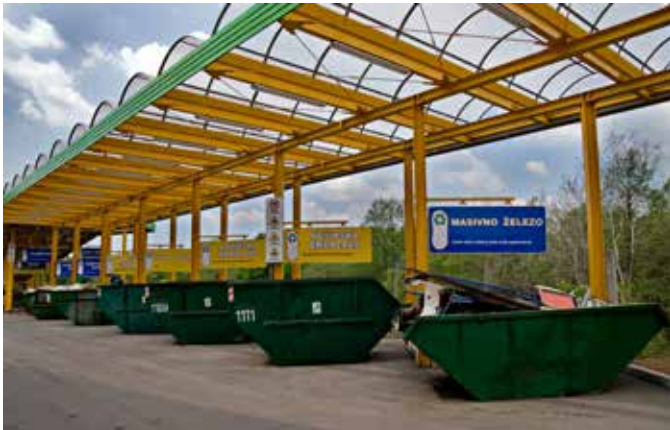
Odlaganje odpadkov iz gospodinjstev je za občane brezplačno; arhiv: VoKa-Snaga

Kadar imate bioloških in/ali mešanih komunalnih odpadkov več kot običajno, jih lahko pospravite v 50- ali 100-litrške Vokine Snagine tipizirane vreče in jih na dan odvoza postavite zraven ustreznega zabojnika. Naenkrat lahko pripravite do pet vreč, pri čemer teža posamezne vreče ne sme presegati 10 kilogramov. Vreče so naprodaj prek spleta ( www.vsezaodpadke.si/vokasnaga ) in v Centru ponovne uporabe na Povšetovi 4 v Ljubljani.