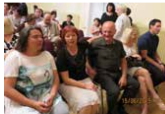
Učiteljski profesorski zbor v dvorani

Nastopajoči so na oder povabili tudi svojo ravnateljico šole, da jim je še zadnjič spregovorila. Pohvalila jih je, da je ponosna na velik uspeh svojih učencev, kar je dokazoval tudi njihov profesionalni nastop in samostojno vodenje programa večera. Učencem je podelila nagrade in pohvale za njihove šolske in obšolske dejavnosti, pohvale so prejeli tudi za odličen uspeh. Podeljena so bila še zaključna spričevala osnovne šole, ki so jih bili vsi veseli.