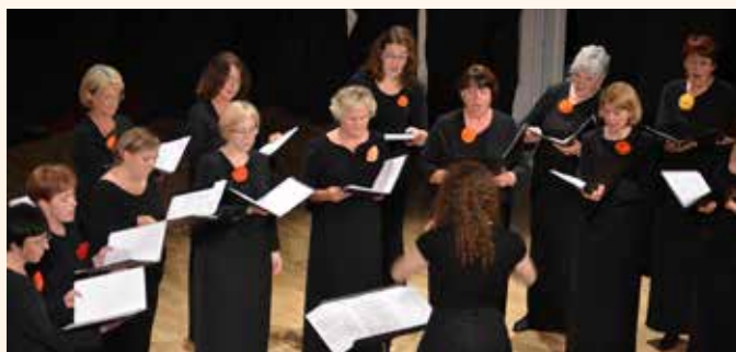
Pesem je tista, ki nas bogati, združuje in povezuje