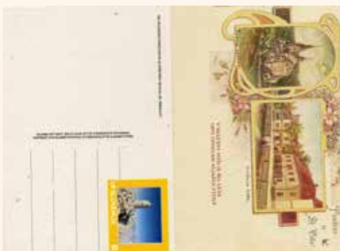
Besedilo in foto: Društvo BPC

Društvo BPC je ob 120-letnici izdelave in postavitve Aljaževega stolpa izdalo ponatis razglednice Šentvida iz okoli leta 1900, kjer je v ospredju Belčeva rojstna hiša. Izdana pa je bila tudi priložnostna znamka z upodobitvijo Aljaževega stolpa. Veliko pozornosti je vzbudila tudi za to priložnost izdelana maketa stolpa kot spominek.