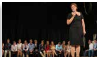
Nagovor ravnateljice OŠ Šentvid