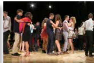
Ples staršev z učenci

V devetih letih šolanja na Osnovni šoli Šentvid so vsi učenci odrasli v prava dekleta in fante, prav nič podobni osnovnošolcem.