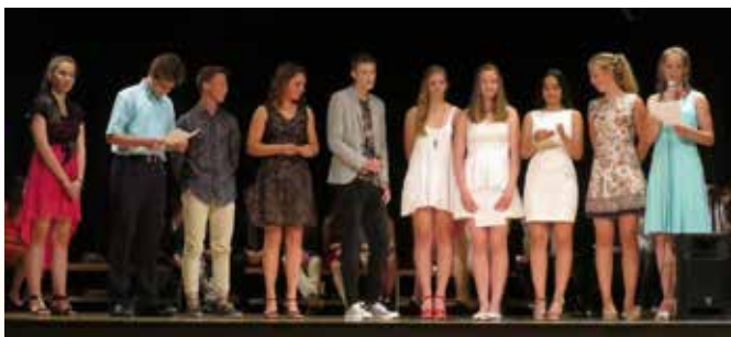
Voditelji zaključne prireditve

Kaj vse so se naučili v šoli in obšolskih dejavnostih, so učenci pokazali v svojih nastopih na odru dvorane. Mlada pevka je ob spremljavi glasbe prav profesionalno zapela izbrano pesem in požela velik aplavz, s pesmijo so nastopali tudi fantje s kitaro, lepo je bilo slišati igrati učence na orglice in harmoniko. Nastopal je tudi pravi čarodej, ki je s svojimi veščinami navdušil vse v dvorani. Tudi nastop akrobatskega plesalca rokenrola, prejemnika zlatega odličja na letošnjem svetovnem prvenstvu, je bilo lepo videti.