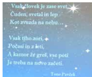
pesem Toneta Pavčka

Cel večer nas je ob odru spremljala lepa pesem Toneta Pavčka.