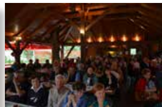
Kljub deževnemu vremenu je bilo na letošnjem Dnevu vižmarsko - brojskih upokojencev več kot 130 udeležencev

Članice in člani, ki so v letu 1980 vplačali članarino, z vso pravico imenujemo ustanovno članstvo. Pred desetimi leti jih je bilo včlanjenih še 46. V arhivskih zapisih smo našli seznam tistih ustanovnih članic in članov, ki so se udeležili slavnostnega obeležja ob 25-letnici ustanovitve društva; bilo jih je ravno petindvajset. Prav je, da se jih spomnimo tudi ob tej priložnosti. Zapisani po abecednem vrstnem redu priimkov so: