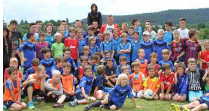
Selektor z mladimi nogometaši NK Arne Tabor 69

Mlajši, starejši in še malo starejši nogometaši in tisti, ki bi to želeli biti, so se pomerili tudi v številnih spretnostnih igrah ter v taborskem kvizu, kjer so testirali znanje o zgodovini NK kluba Tabor 69, poznavanju okoliške zgodovine kot tudi slovenskem in mednarodnem nogometu. Skratka, kot je na Taboru že običaj, je bilo lušno, zato na začetek sezone pridi tudi ti!