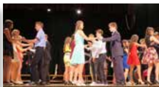
Četvorka na odru

Kaj vse so se naučili v šoli in obšolskih dejavnostih, so učenci pokazali v svojih nastopih na odru dvorane. Mlada pevka je ob spremljavi glasbe prav profesionalno zapela izbrano pesem in požela velik aplavz, s pesmijo so nastopali tudi fantje s kitaro, lepo je bilo slišati igrati učence na orglice in harmoniko. Nastopal je tudi pravi čarodej, ki je s svojimi veščinami navdušil vse v dvorani. Tudi nastop akrobatskega plesalca rokenrola, prejemnika zlatega odličja na letošnjem svetovnem prvenstvu, je bilo lepo videti.