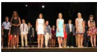
Postavili so se na odru