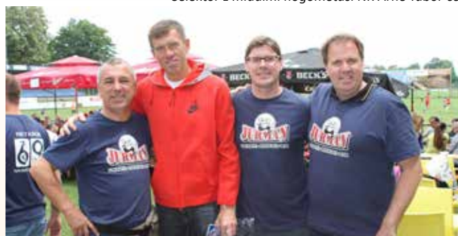
Vodstvo NK Arne Tabor in selektor