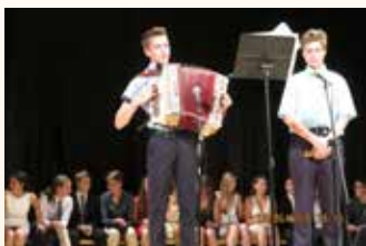
Igranje na orglice in harmoniko