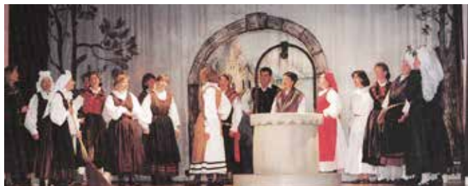
Koncert od lepe Vide v narodnih nošah